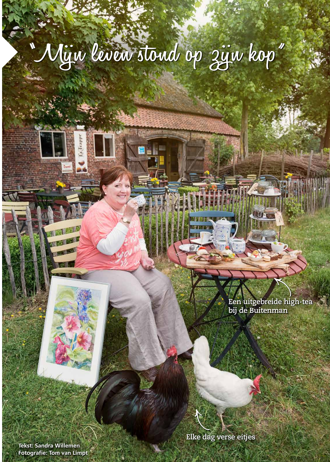
Een uitgebreide high-tea bij de Buitenman