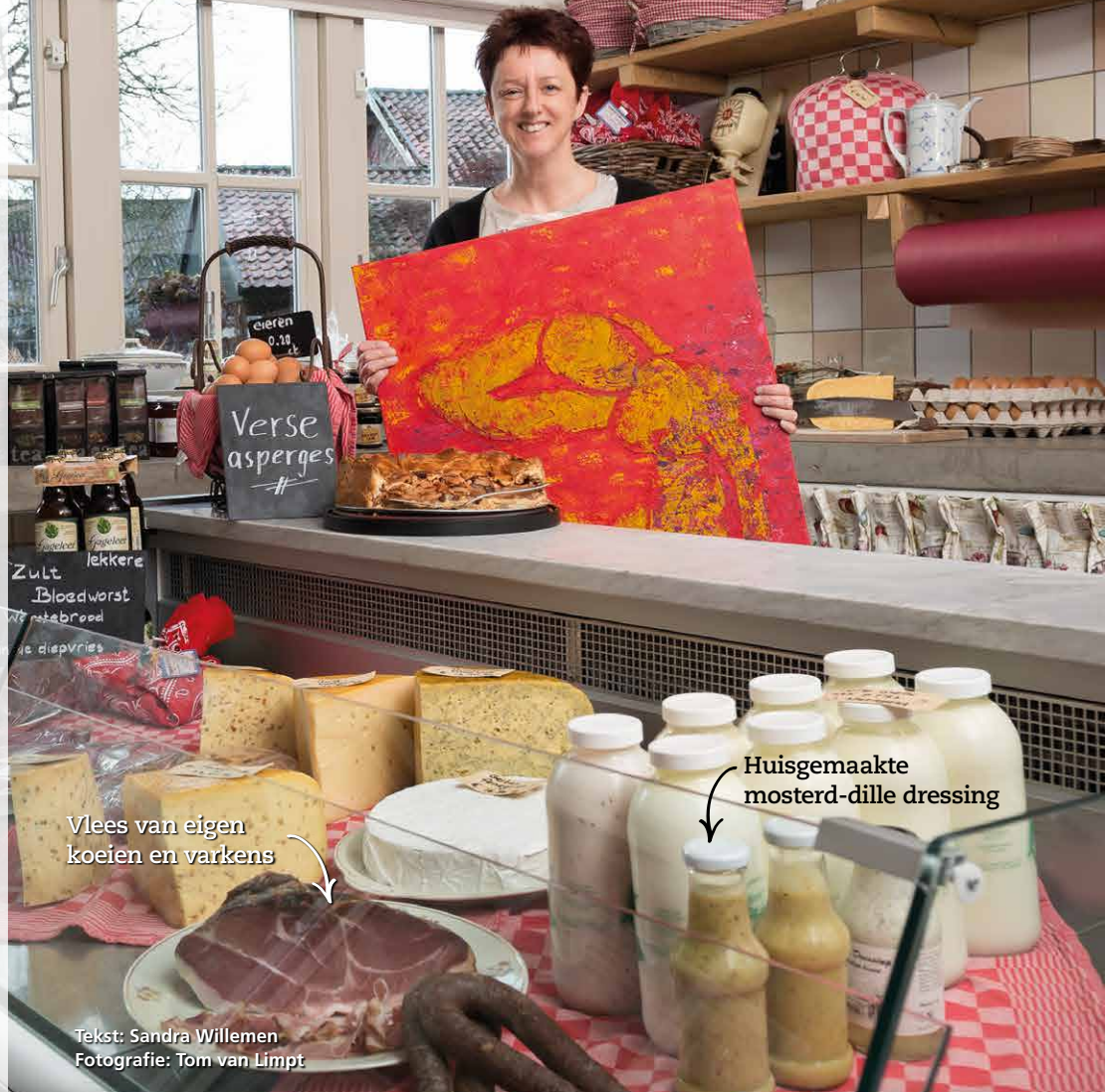
Vlees van eigen koeien en varkens

"Ineens hoorde ik allemaal zoemende geluiden"